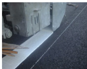
Przykład znakowania „gładkiego”