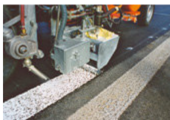
Przykład znakowania „strukturalnego”

Installation work at the customer (outside of Europe) is charged individually, separately Einbauarbeiten bei der Kunde (ausserhalb Europa) werden individuell, separat verrechnet. Prace adaptacyjne u klienta (poza Europa) będą wyceniane indywidualnie